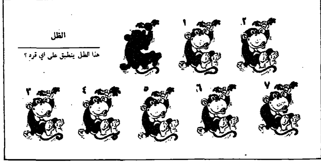
هذا الطفل ينطبق على اي فرد ؟

من خلال التخصص ومواكب الفني عدت بالتفكير الى ما قبل ١٩٤٨ باستعراض النشاطات الفنية السابقة ، وللأسف الشديد لم اجد اي شيء يذكر . وما اريد ان اقله هو : انه لا توجد هنا قاعدة للفن بشكل عام ، وتعودنا ان نستورد من الخارج معظم اغانينا وموسيقانا الصابحة . وهذا بدون شك ، ترك اثرا على عدد من الاشخاص الذين لهم اليوم صلة سطحية في الموضوع وهم الذين نصبوا انفسهم (مشايخ) على الامور الفنية في البلاد وللأسف الشديد بدأوا في تقرير الامور الفنية